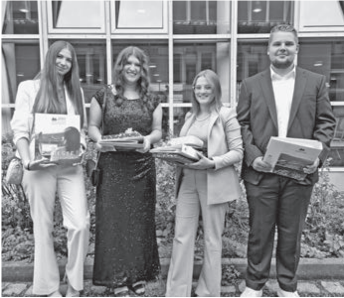
Am Foto die vier Absolventen des Gymnasiums.

Wir wünschen allen Absolventen viel Erfolg auf ihren weiteren schulischen Werdegang bzw. allen die eine Ausbildung beginnen einen guten Start ins Arbeitsleben.