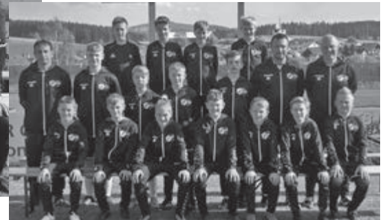
Die D-Jugend der SG Kirchdorf-Rinchnach präsentiert sich stolz in dem neuen Outfit