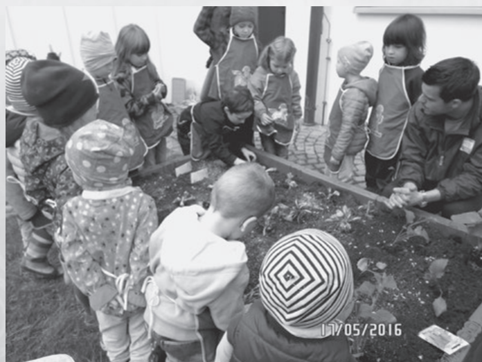
Zusammen mit Edeka Saxinger fand die alljährliche Pflanzaktion statt. Das Gemüse wurde beim Frühstücksbuffet verwertet.