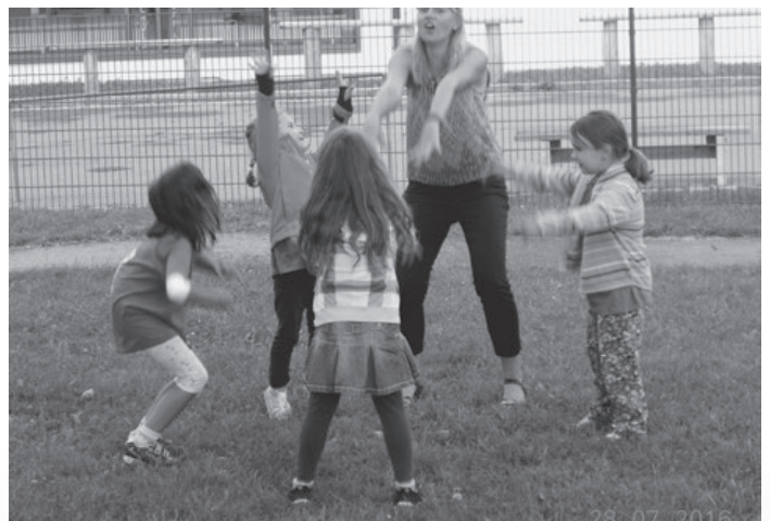
Bei fetziger Musik, lustigen Spielen, leckeren Grillwürsteln und ganz viel Spaß ließen wir die gemeinsame Kindergartenzeit ausklingen.

Beiträge für die nächste Ausgabe des „KIRCHDORFA GMOABLADL“ werden bis 2. Dezember 2016 erbeten.