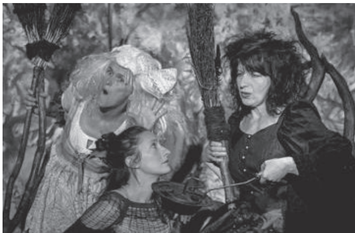
Wie auch in den vergangenen Jahren durften die Kindergartenkinder nach Regen zu den Kinder-Kultur-Tagen fahren. In diesem Jahr haben wir uns das Tanz-Theater „Die kleine Hexe“ angesehen.