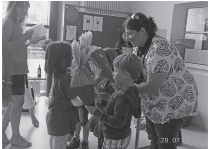
Nach dem Gottesdienst und nach der Überreichung der Schultüte als Abschiedsgeschenk vom KiGa, durften die Schulanfänger noch zu unserer Abschlussfeier im KiGa bleiben.