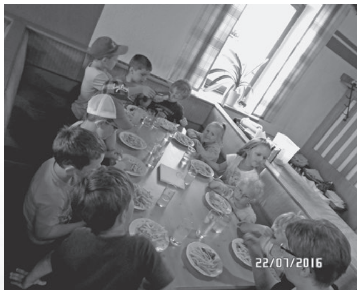
Ein ganz besonderes Ereignis war auch das Pommes-Essen im Gasthaus Baumann. Danke dafür!