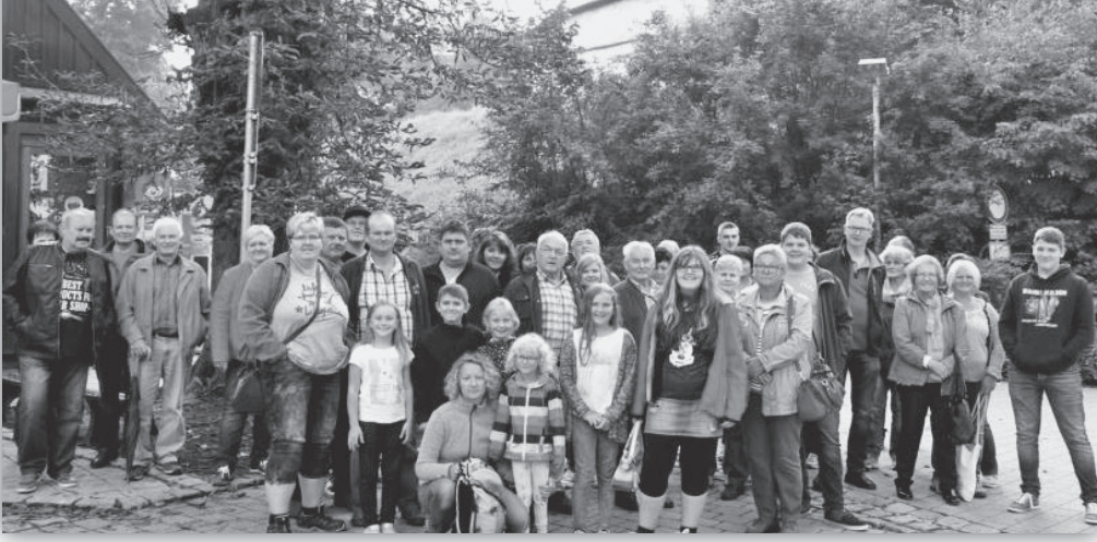
Die Haiderer Schnupfer auf der Veste Coburg