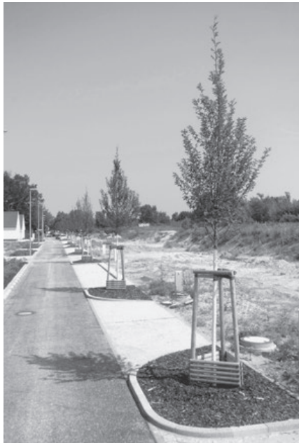
Elf Hainbuchen säumen bereits die neu gebaute Straße