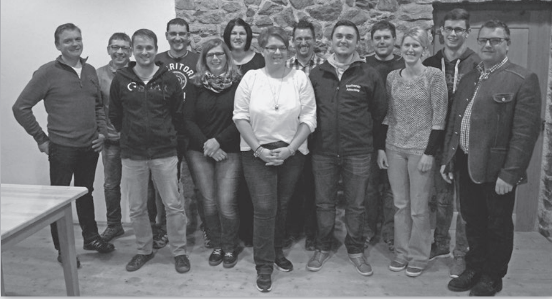
Die neu gewählte Vorstandschaft des Dorfvereines