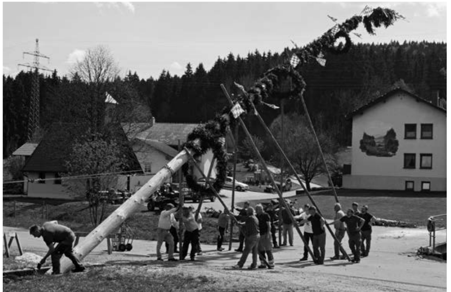
Maibaum in Bruck