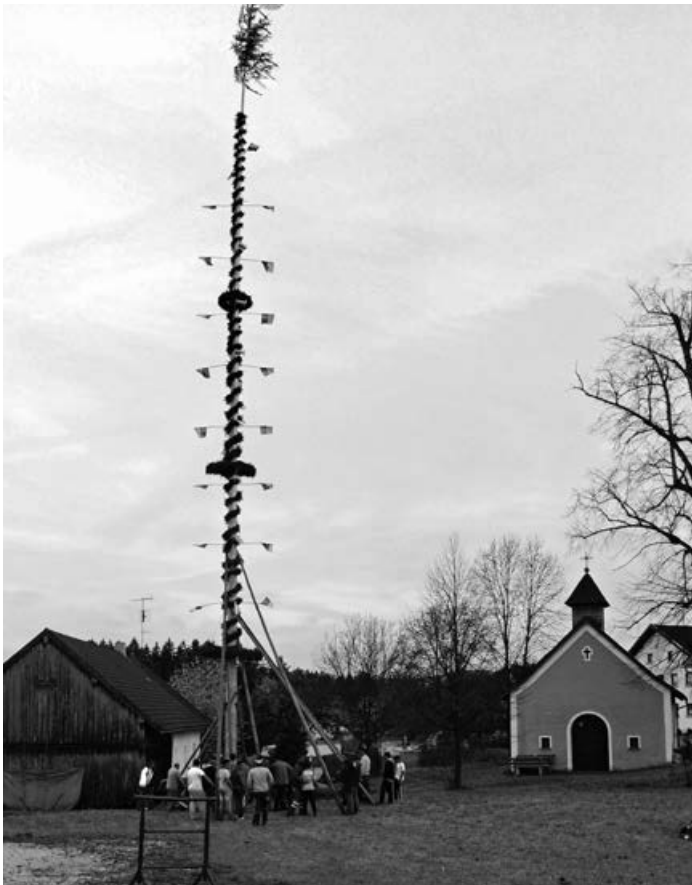
Maibaum in Abtschlag

Beiträge für die nächste Ausgabe des „KIRCHDORFA GMOABLADL“ werden bis 16. September 2016 erbeten.