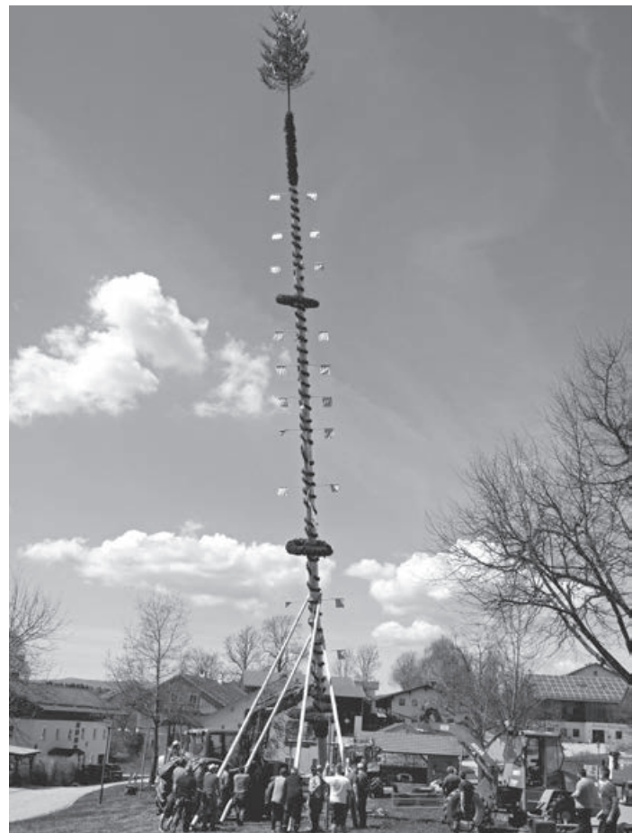
Maibaum in Trametsried