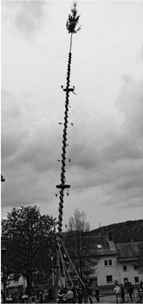
Maibaum in Kirchdorf