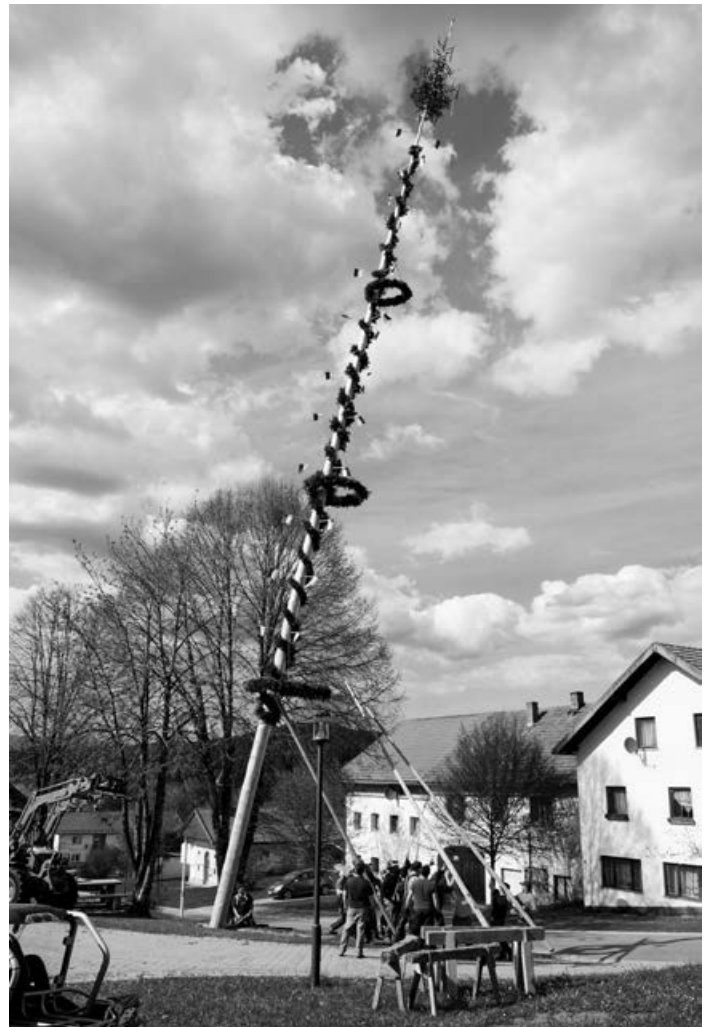
Maibaum in Schlag