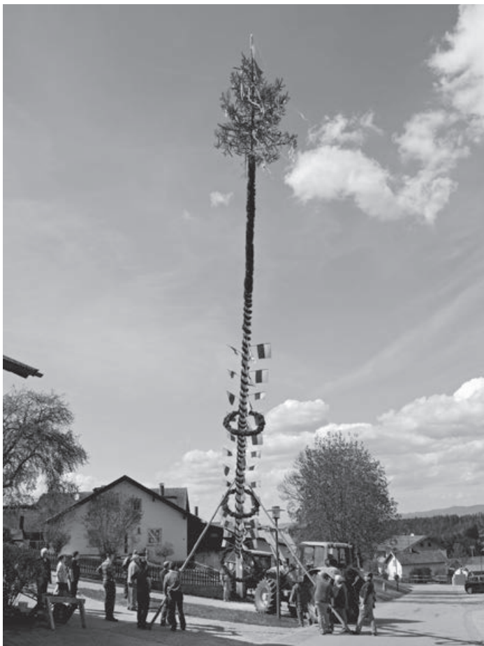
Maibaum in Haid

lud der Theaterverein wieder zum Maifest ein und bei Brotzeit, Kaffee und Kuchen saß man gemütlich am Dorfplatz beisammen. Die Gemeinde Kirchdorf i. Wald möchte sich bei all den vielen Helfern, die beim Herrichten, Schmücken, Aufstellen usw. mitgeholfen haben, herzlich bedanken. Ein besonderer Dank gilt auch allen Bürgern für die Spende der Bäume.