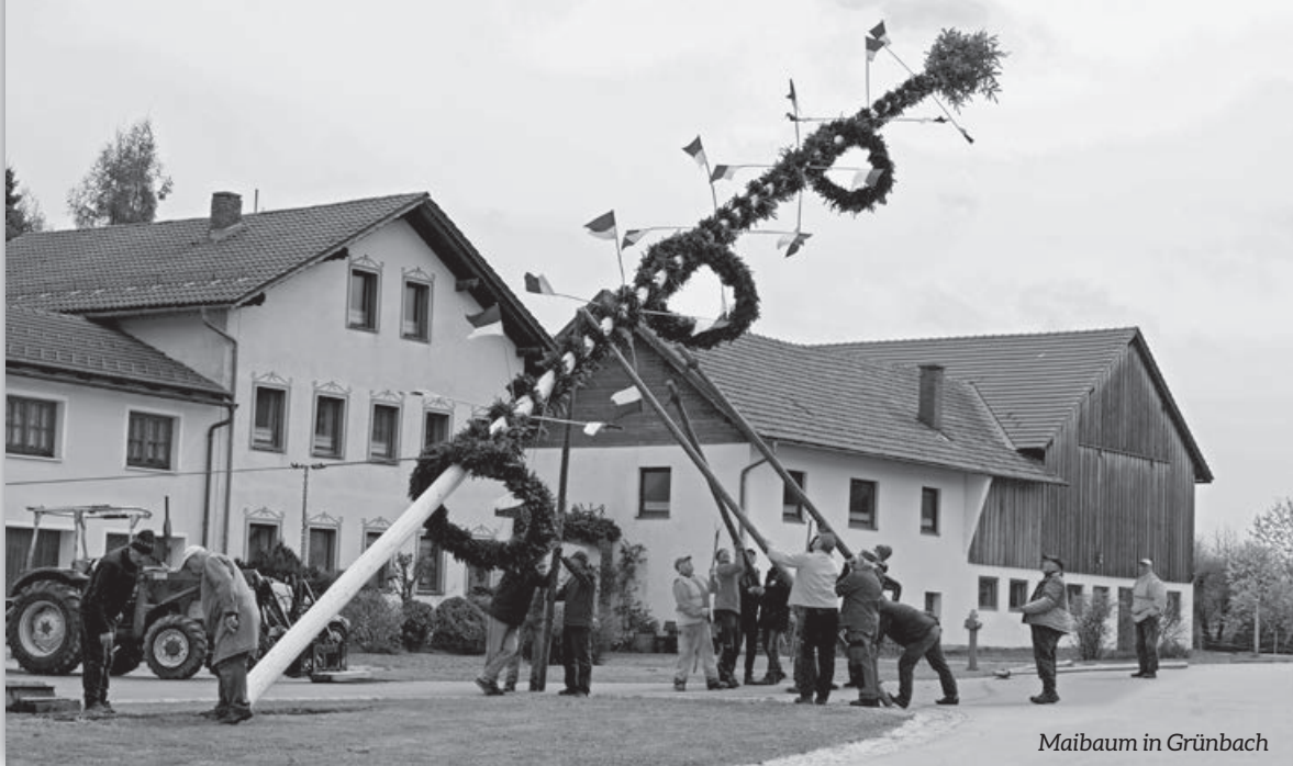
Maibaum in Grünbach